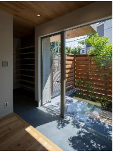
プロスペリテ野芥駅Ⅱ -neos-

宅地・戸建販売事業は福岡都市圏半径8km圏を常に目指しながら、近くの特に東方面のエリア開拓も進めようとしています。昨年商品企画して成功したプロスペリテneos(ネオス)シリーズ、今年は5,000～5,500万円台建売がチャレンジできるエリアでマンションと競合しても勝てる商品づくりをブラッシュアップして、第3弾、4弾と出していく所存です。